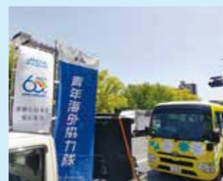
←当日振った旗。 (ミッキーを書いてと言われました...)